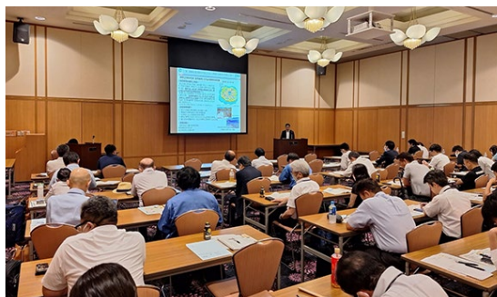
グリーン成長セミナー