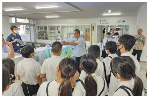
高校生による小学生へのニホンアワサンゴの説明