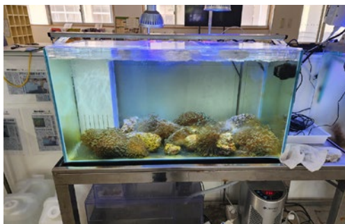
校内に設置したニホンアワサンゴの飼育用水槽