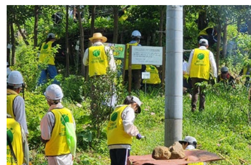
ニホンアワサンゴ生息地周辺の里山整備活動