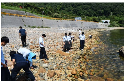
ニホンアワサンゴ生息地周辺の海岸保全活動