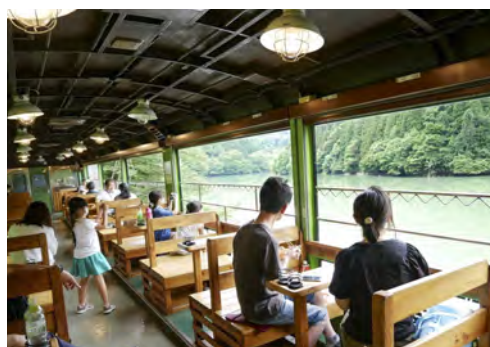
(4) 企画列車(風っこ号)の車内