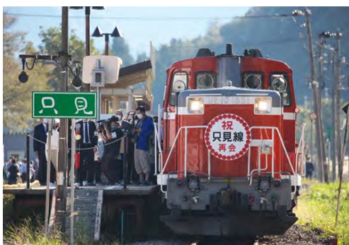
(3) 只見駅に到着した全線運転再開の記念列車(2022年10月1日)