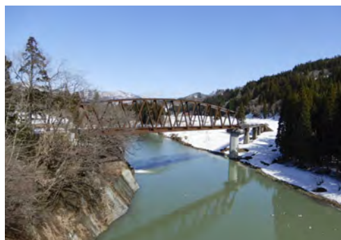
(2) 復旧後の第7只見川橋りょう