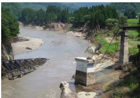
(1) 橋脚が流失した第7只見川橋りょう