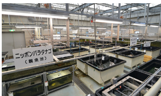
保護増殖センター