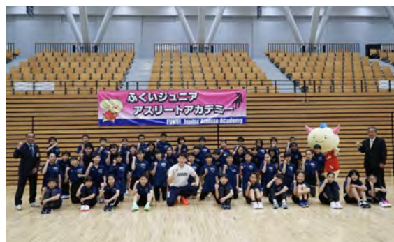
アスリートアカデミー参加者