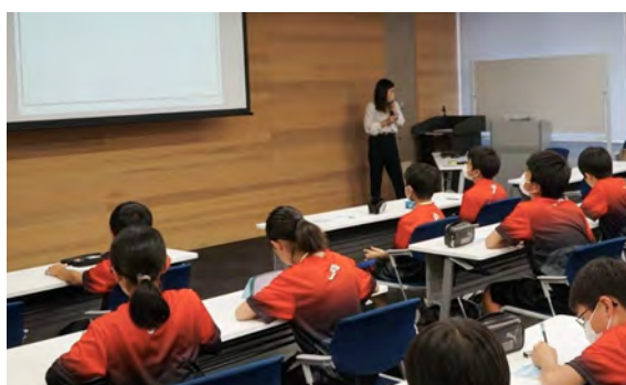
メンタルトレーニング講座の様子