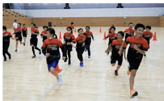
知識・運動能力を高めるプログラム