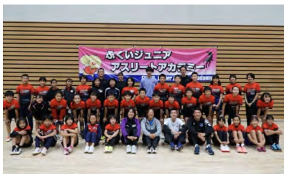
アスリートアカデミー参加者