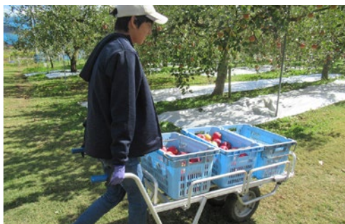
LEARNりんご農園(東大先端研)