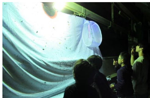
LEARN昆虫観察(東大先端研)