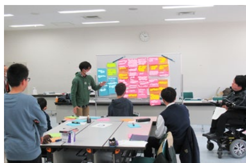
夢・志ワークショップ(東大先端研)