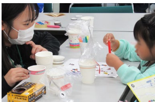
ワークショップコレクションinやまぐち