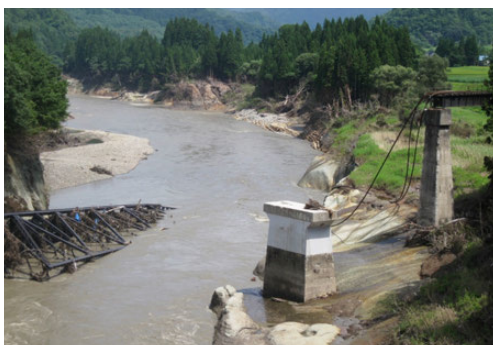
(1) 橋脚が流失した第7只見川橋りょう