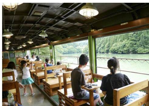
(4) 企画列車(風っこ号)の車内