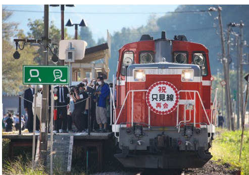
(3) 只見駅に到着した全線運転再開の記念列車(2022年10月1日)