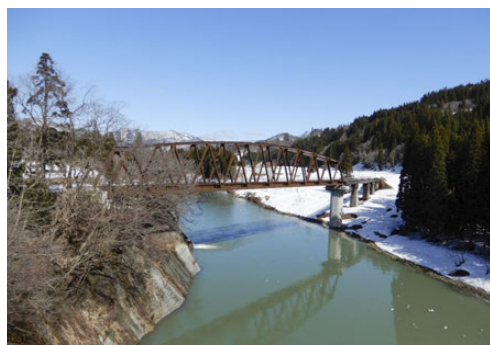
(2) 復旧後の第7只見川橋りょう