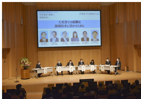
普及啓発活動（シンポジウム開催）