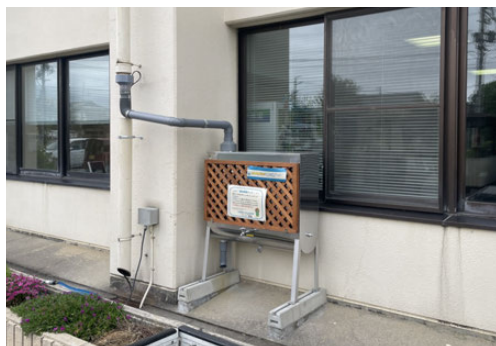
安曇野町舎の設置事例