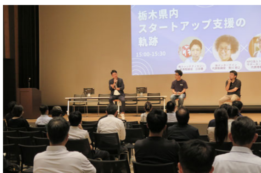
スタートアップ企業交流イベント_トークセッション