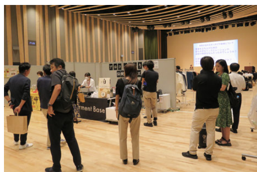
スタートアップ企業交流イベント_企業ブース