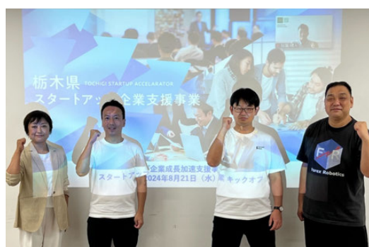
スタートアップ企業成長加速支援事業_キックオフ