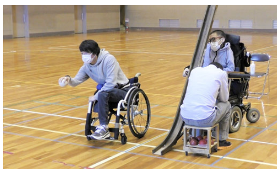
ポッチャセット活用イメージ