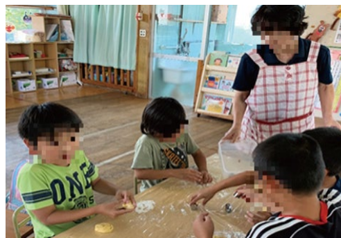
「子どもの居場所」で提供を受けた食材でお菓子作り